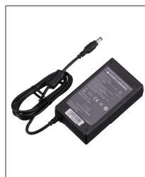
AC 交流适配器 ADC-15